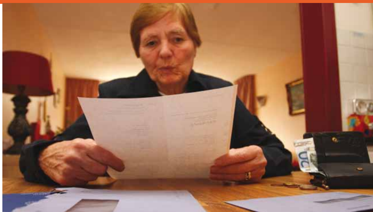
De belastingservice van Beweging 3.0 neemt u veel zorgen uit handen.

Van februari tot en met mei is het een drukte van jewelste bij Verkerk&Partners. Veel leden van Beweging 3.0 laten in deze periode hun belastingaangifte verzorgen. "Aanvragen is dan