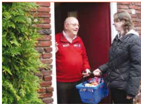
Supermarkt De Ruig bezorgt uw boodschappen aan huis. Voor een praatje is altijd tijd!

Probeer eens een proefmaaltijd voor maar € 2,50