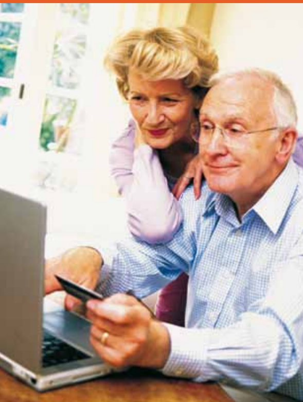
U hoeft niets te doen en u kijkt mee hoe Computerzorg op afstand op uw computer de problemen oplost.