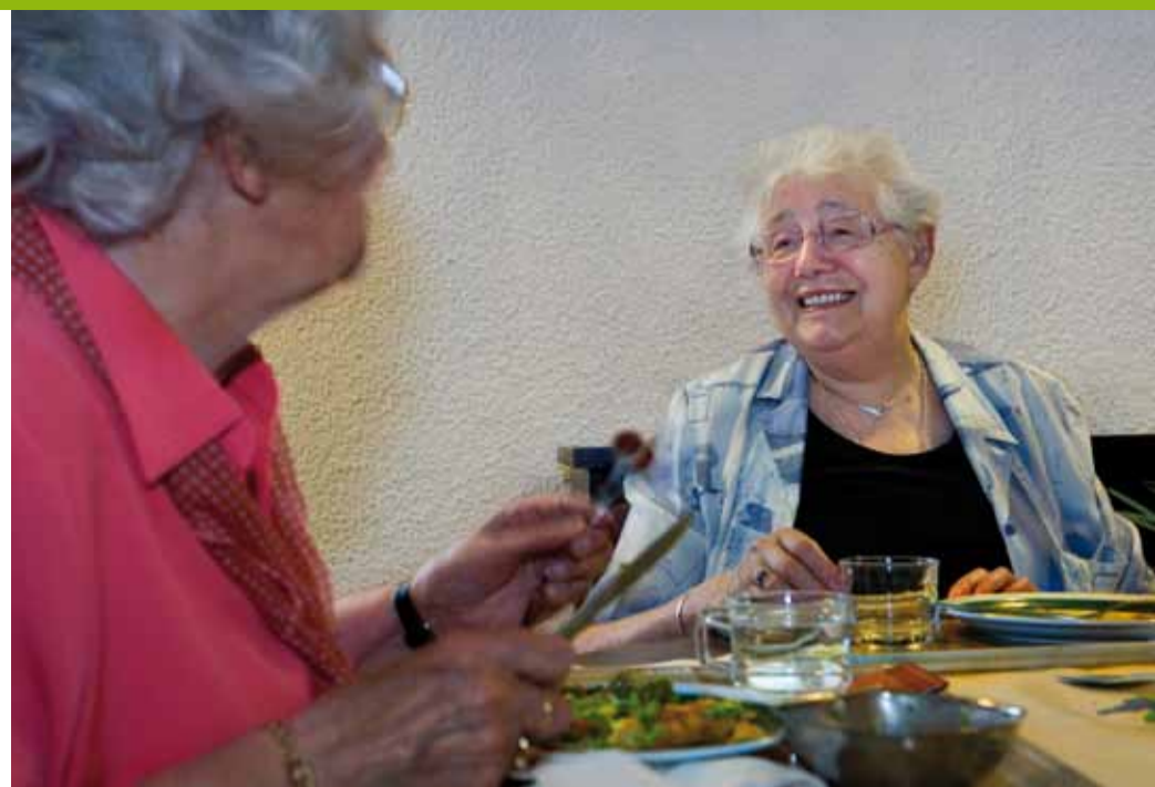
Voor speciale gelegenheden, zoals een verjaardag of kerst, kunt u voortaan ook superieur maaltijden bestellen.

Via internet bestelt u nu nog sneller uw maaltijden: www.beweging3.nl/alliediensten . Of vul de bon in op pagina 4 en stuur hem op.